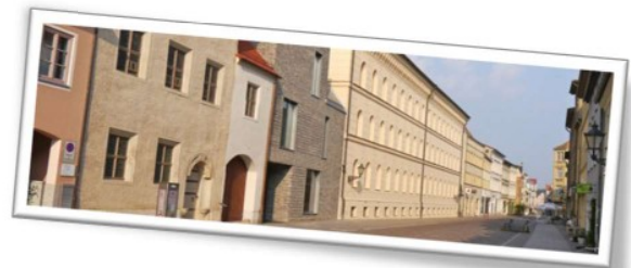
Das im Stil der Renaissance erbaute Melanchthonhaus ist eines der schönsten Bürgerhäuser der Lutherstadt Wittenberg.