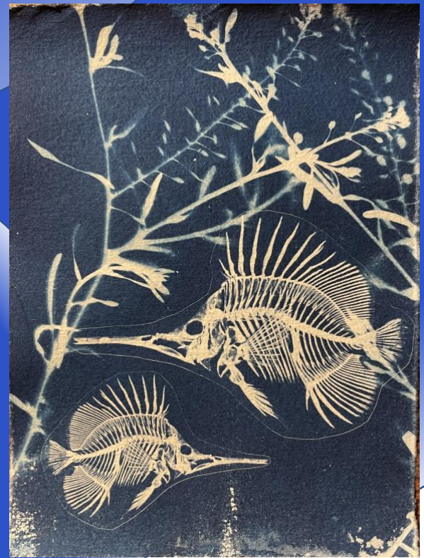
Altes Aquarium, Cyanotypie